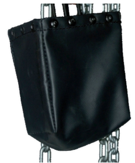
Option: bac pour chaîne de levage