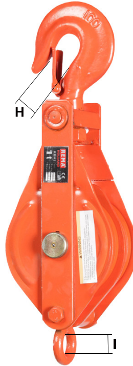
KBH2 = 2 réa