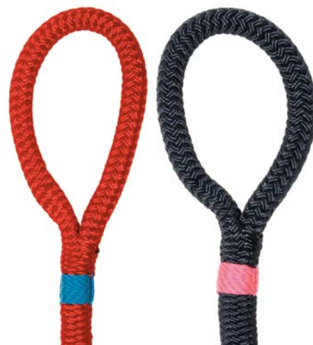
EN VRAC OU ÉPISSÉE